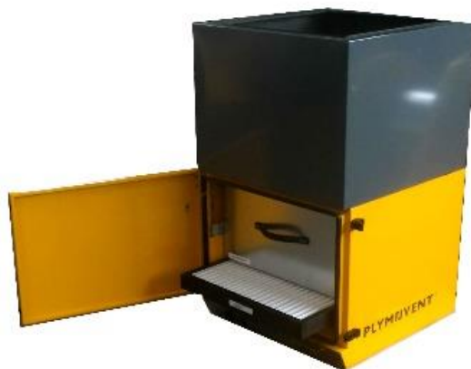
Prefiltro e cassetta filtrante a carboni attivi