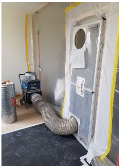
Porta apribile con magneti