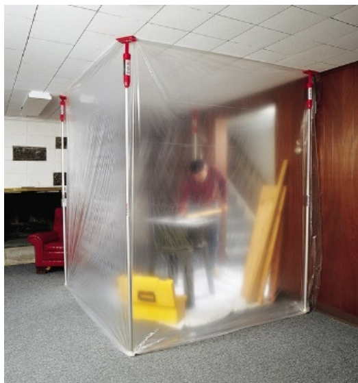
Teloni di isolamento