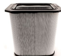
Filtro Hepa H13