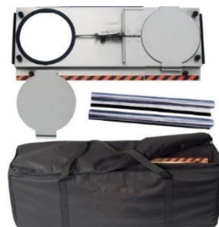
Pannello metallico per porta