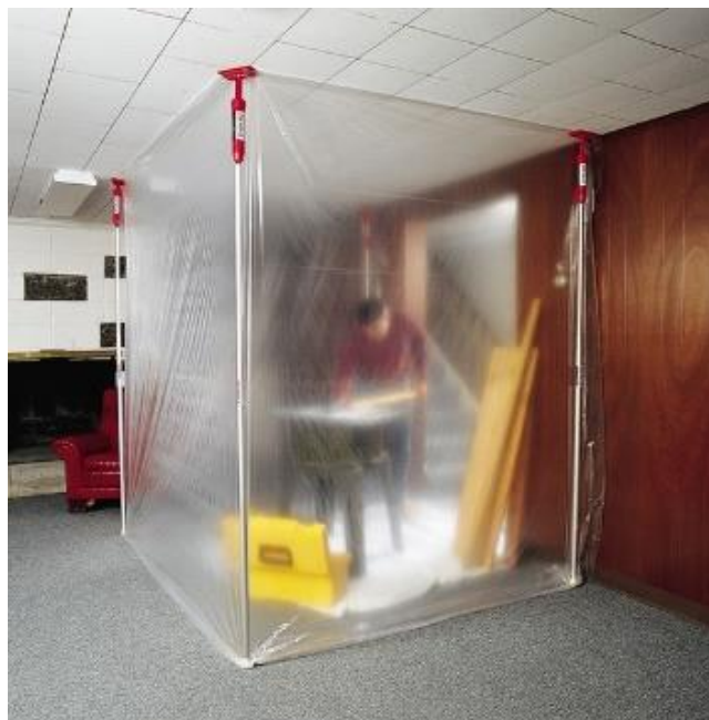
Teloni di isolamento