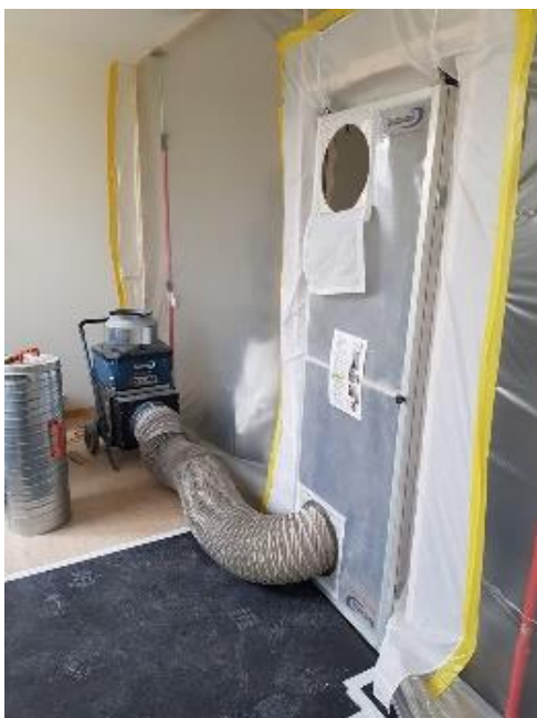
Porta apribile con magnete