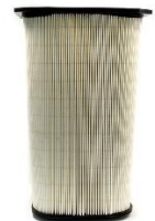
Filtro Hepa H13