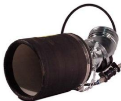
Bocchetta pneumatica, mod. Grabber