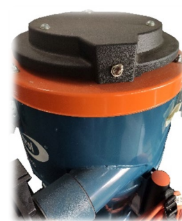
Interruttore per effettuare la pulizia dei filtri