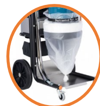
DC TROMB 400L