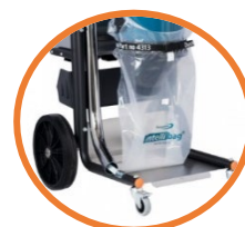
DC TROMB 400C