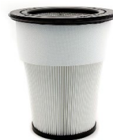
Filtro in poliestere LAVABILE