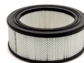
Filtro Hepa H13