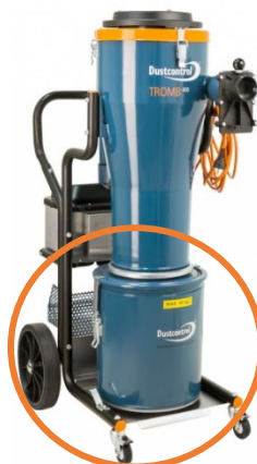
DC TROMB 400A

Ogni versione è dotata di due cartucce filtranti concentriche, la cui pulizia si effettua ad aspiratore chiuso, in totale sicurezza, tramite un flusso d'aria in controcorrente che si scatena premendo semplicemente una levetta posta in sommità alla testa della macchina.